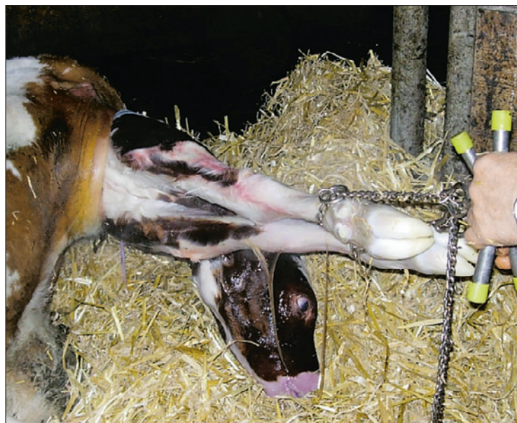
Une hygiène optimale au vêlage réduit le risque d'infection de la matrice.