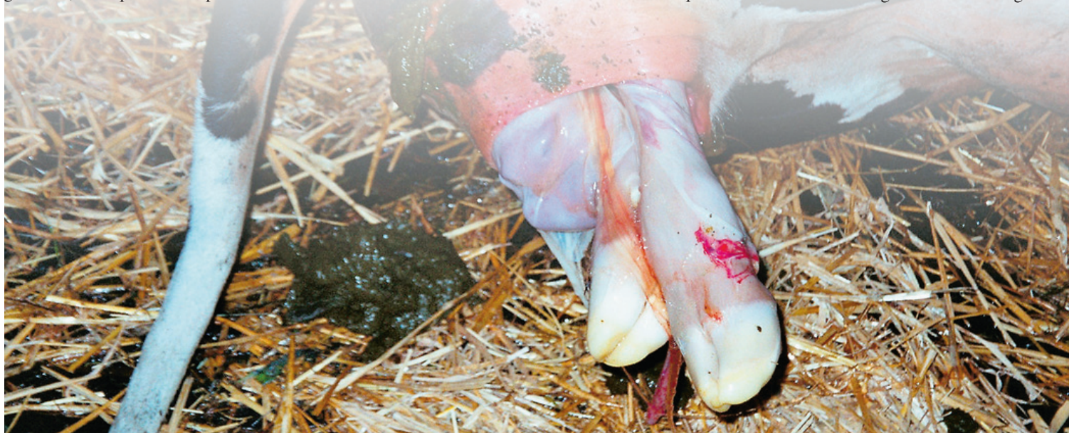
Dès la rupture de la poche des eaux et jusqu'au passage de la tête du veau, il peut facilement se passer de 4 à 6 heures chez les génisses.

Entre la rupture de la poche des eaux et le passage de la tête du veau, il peut s'écouler une à trois heures chez les vaches et quatre à six heures chez les génisses, sans qu'aucune aide au vêlage ne soit nécessaire. Une fois que la tête du veau a passé la vulve, le vêlage devrait être terminé après 15 minutes au plus. Une intervention trop précoce (tirer dès que les pattes sont atteignables) transforme souvent un vêlage normal en vêlage diffi-