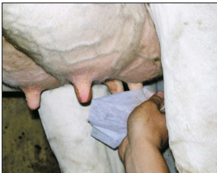
Für ein aussagekräftiges Resultat ist es sehr wichtig, sauber und korrekt Milchproben zu entnehmen.

Weist eine Herde jedoch eine theoretische Tankzellzahl von >150'000 Zellen/ml Milch auf, handelt es sich definitionsgemäss