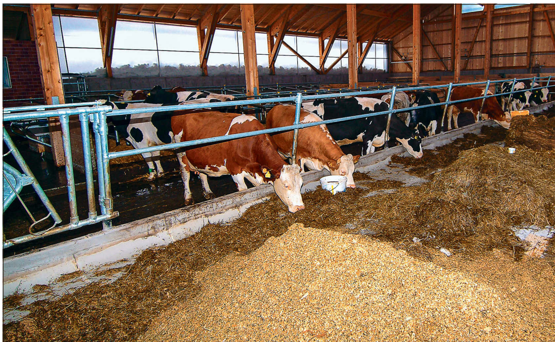
Bei der Verfütterung von Silage ist es wichtig, dass sie von guter Qualität ist und einen tiefen pH-Wert von unter 4.5 aufweist.

mfl. Kuh Lora hat gerade den Melkstand passiert und läuft wackelig in Richtung Futter. Sie fühlt sich unwohl. Bereits am Morgen konnte sie nicht richtig fressen, jetzt ist es noch schlimmer, sie kann ihre Zunge kaum noch bewegen. Obwohl Lora ziemlich Durst und Hunger hat, schafft sie es nicht Wasser zu schlucken oder ein wenig Silage zu fressen. Sie versucht es noch ein letztes Mal, trotz langsamem Kauen fällt ihr das Futter wieder aus dem Maul. Auch Loras Kollegin Milka fühlt sich nicht gut, gestern Abend haben sie noch nebeneinander die vorgelegte Silage verschlungen aber heute Morgen liegt sie in der Liegebox fest. Zum Glück schaut der Bauer nach dem Melken vorbei. Ihm ist aufgefallen, dass Lora wenig Milch gab. Lora und Milka anschauend, greift er zum Telefon und ruft den Tierarzt.