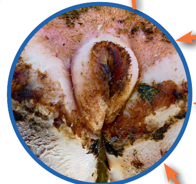
M4: Chronisches Stadium, blumenkohlartiges Aussehen, nur oberflächlich abgeheilt, Bakterien in der Tiefe.